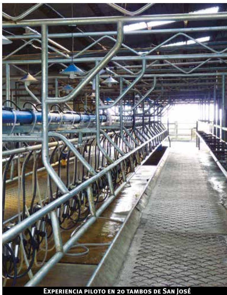
EXPERIENCIA PILOTO EN 20 TAMBOS DE SAN JOSÉ

El Piloto "Proyecto de Inversiones y Asesoramiento a tambos en eficiencia energética" tiene como