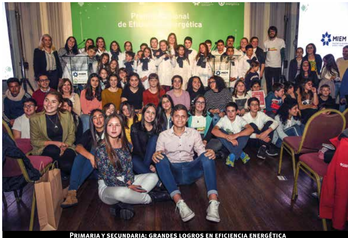
PRIMARIA Y SECUNDARIA: GRANDES LOGROS EN EFICIENCIA ENERGÉTICA

Premio: MEVIR. Se otorgó el premio por el compromiso en la mejora de la eficiencia energética en el diseño constructivo de más de 1000 viviendas en todo el país. Además, incorporó capacitación a los hogares y equipamiento eficiente, mejorando el confort con menor costo.