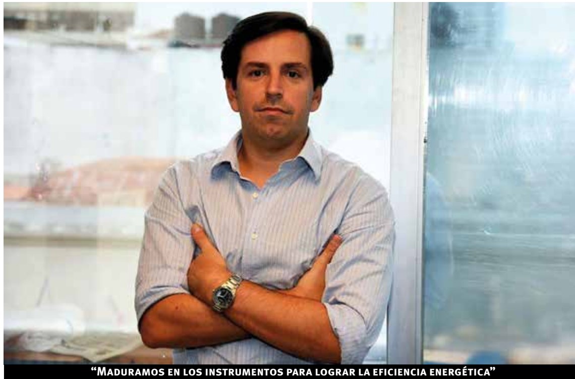
“MADURAMOS EN LOS INSTRUMENTOS PARA LOGRAR LA EFICIENCIA ENERGÉTICA”

Muchas veces los primeros trabajos condicionan el futuro laboral de uno. Este tema de la energía es tan amplio, que ocupa a personas con conocimientos de muchas especialidades. En la Dirección de Energía hay economistas, ingenieros, contadores, comunicadores, sociólogos, politólogos, entre otros. Esto se debe a que la lógica de los proyectos lo requiere así porque en realidad la energía es multidisciplinaria, tiene muchas aristas. Por ejemplo, cuando hablamos del impulso de la política