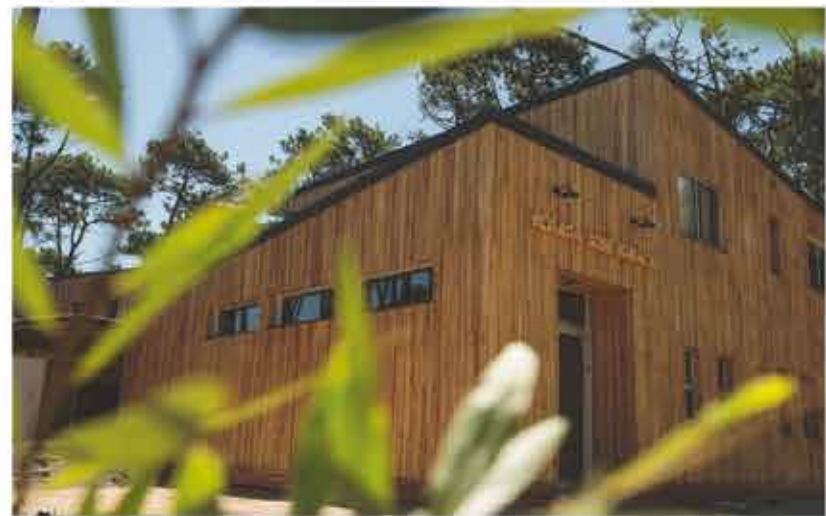
Posada José Ignacio (exterior)