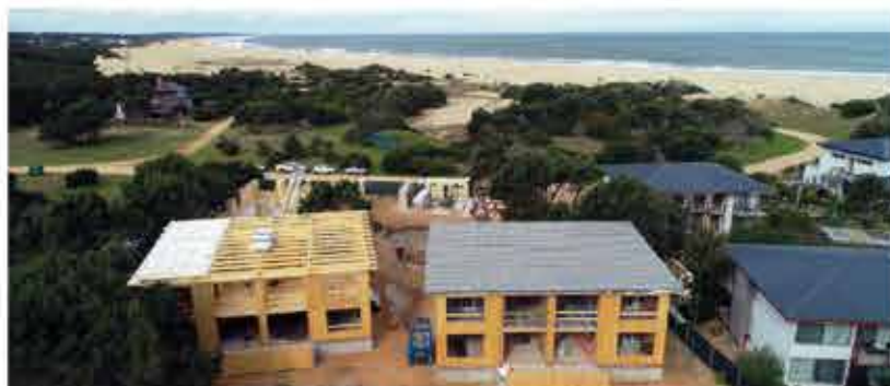
Anastasio Beach and Resort de José Ignacio

Siguiendo la línea de innovación en eficiencia energética y de la toma de decisiones inteligentes, nace el proyecto Anastasio. Este es el segundo proyecto de hotelería en madera creado de la mano de Enkel Group Uruguay, en el que también utilizamos las más eficientes tecnologías y la materia prima más noble que la naturaleza nos puede brindar.