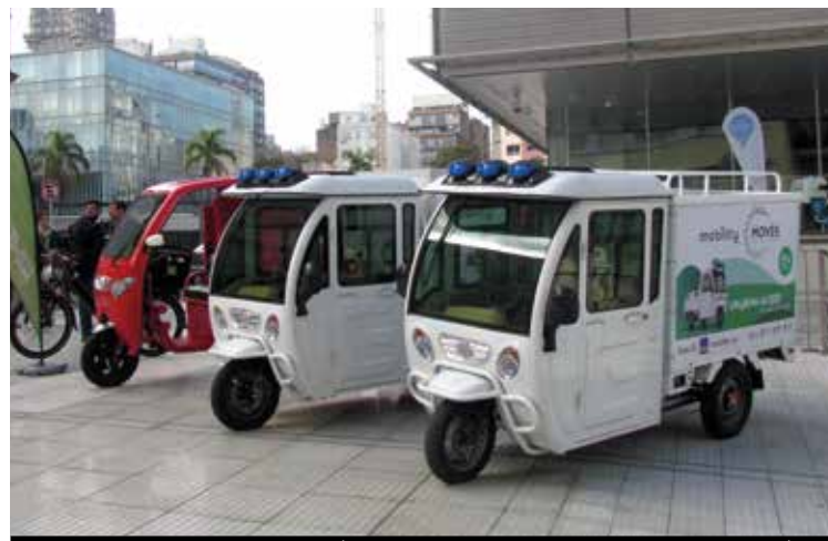
EMPRESAS: UTILITARIOS ELÉCTRICOS A PRUEBA SIN COSTO POR 30 DÍAS

Planes Institucionales de Movilidad Sostenible (PIMS): En el área metropolitana el 48% de los viajes son rutinarios (trabajar o estudiar). Dado que estos viajes comparten un destino común (la institución de trabajo o estudio), se