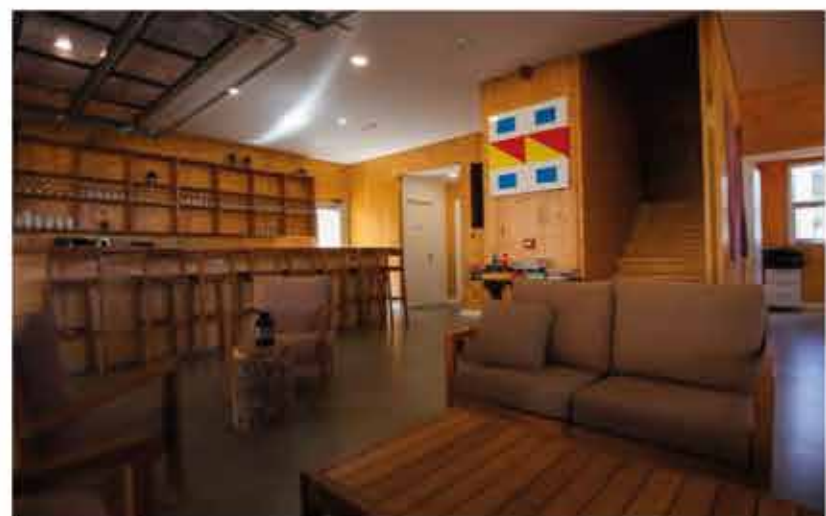
Posada José Ignacio (interior)