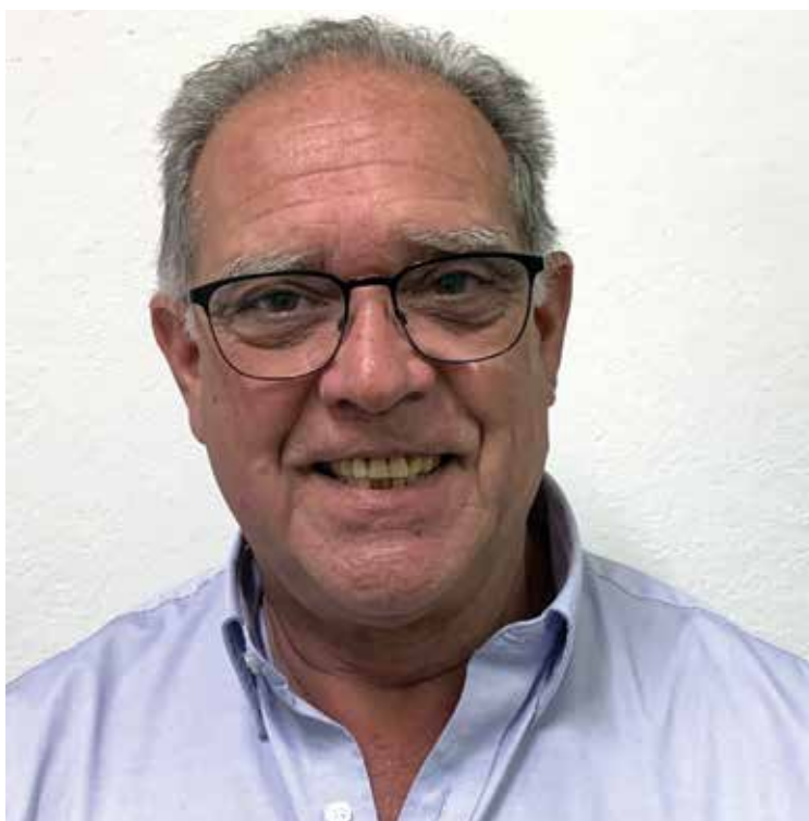
“ES IMPORTANTE QUE SE SEPA QUÉ HACEMOS EN EFICIENCIA ENERGÉTICA”